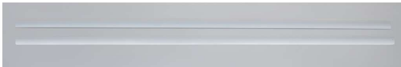
VODÍCÍ LIŠTY 2X